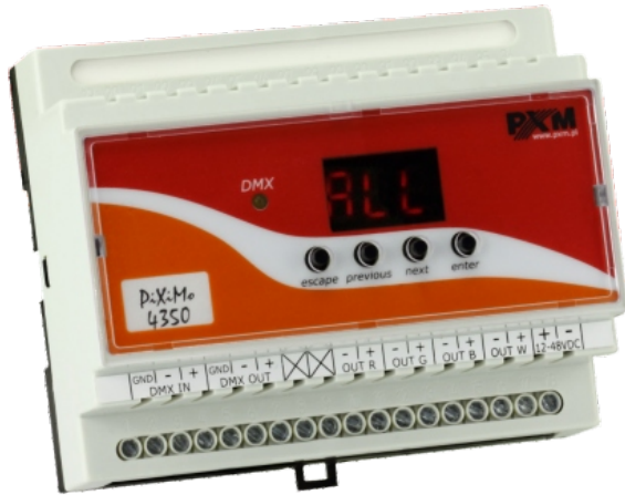
PiXiMo 4350 LED Driver 4x350 mA