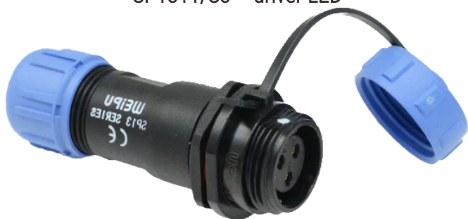
SP1311/S3 – driver LED